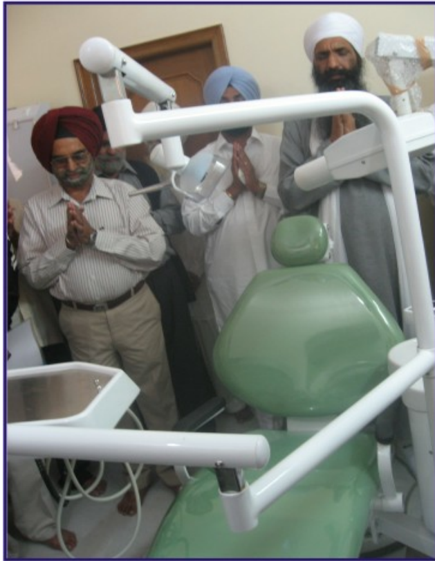
ਬਿਰਧ ਆਸ਼ਰਮ ਰਤਵਾੜਾ ਸਾਹਿਬ ਵਿਖੇ ਡੈਂਟਲ ਚੇਅਰ ਦਾ ਸ਼ੁਭ ਉਦਘਾਟਨ ਸਮੇਂ ਦਾ ਅਰਦਾਸ ਦ੍ਰਿਸ਼।